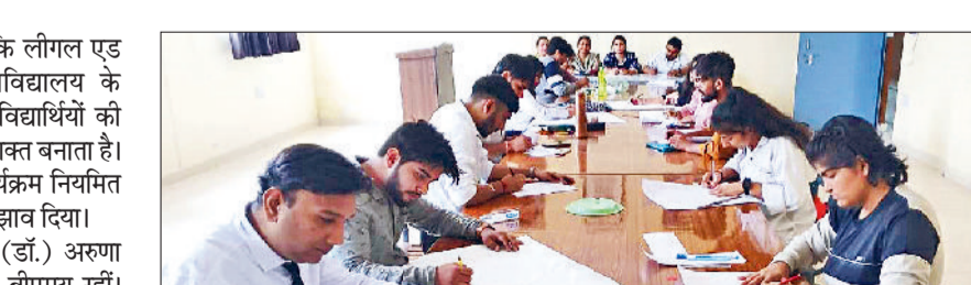
रोहतक। बीएमएयू में सभी के लिए न्याय विषय पर विधि संकाय ने आयोजित प्रतियोगिता के प्रतिभागी।